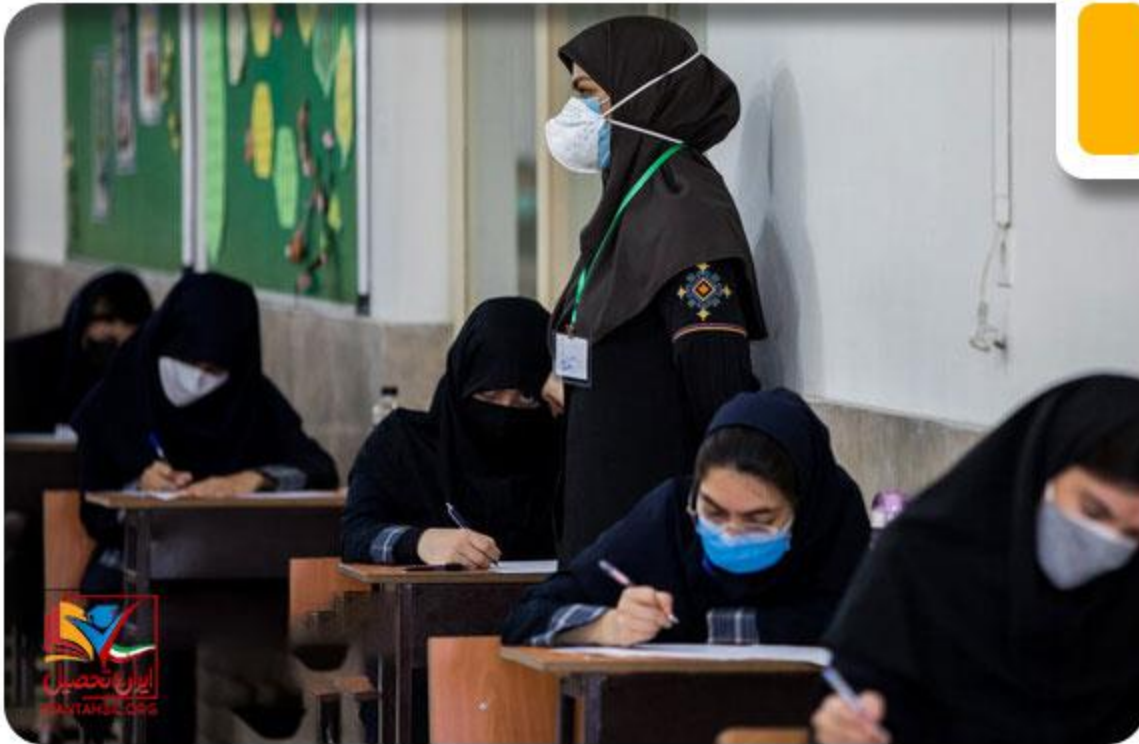
شهریه مدارس غیر حضوری