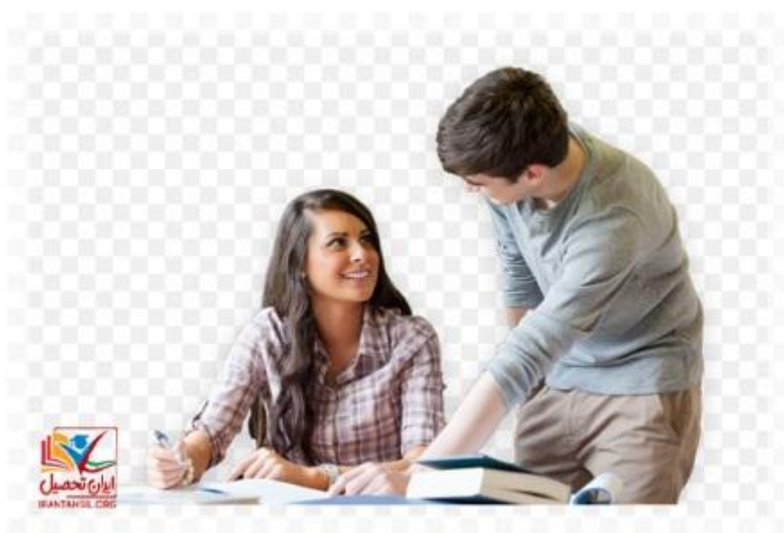
چارت درسی مدیریت بازرگانی دانشگاه آزاد اسلامی