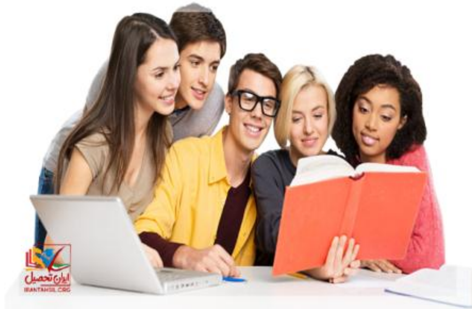
چارت درسی مدیریت بازرگانی دانشگاه آزاد