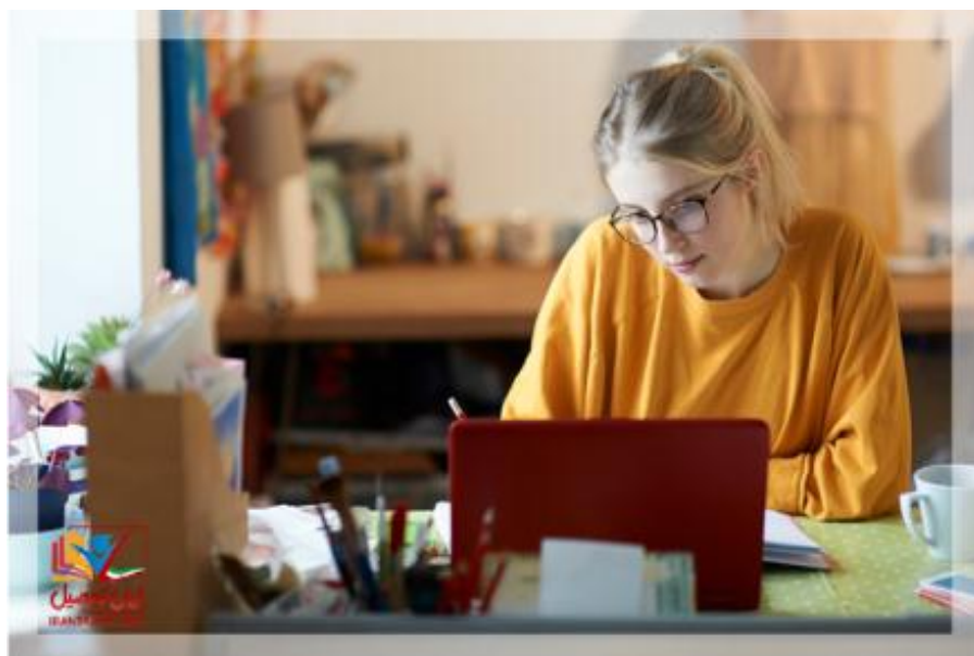
چارت درسی مدیریت بازرگانی دانشگاه پیام نور